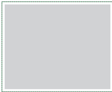
1:1 Vorlage auf Seite 2